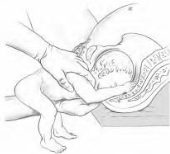
5 Naissance par le siège, rétention tête dernière : la traction est effectuée en sens contraire du mécanisme classique et explique les avulsions des racines proximales.

musculaires sont totalement asymétriques entre le membre paralysé et le côté sain hypertonique en flexion physiologique. Le nourrisson plus âgé, ou l'enfant, se présente souvent avec une attitude en rotation interne globale du membre, parfois en flessum du coude et en supination de l'avant-bras, main ballante pour les paralysies complètes.