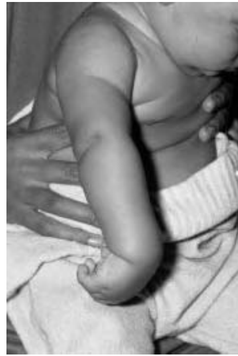
6 Tableau clinique d'une paralysie obstétricale du plexus brachial avec atteinte C5, C6, C7 et C8.

L'examen neurologique, indispensable pour éliminer des pathologies centrales ou médullaires (ischémies anténatales, tumeurs cérébrales ou médullaires), s'attache à mettre en évidence les réflexes néonataux archaïques chez le nouveau-né qui vont disparaître vers le 3 e mois de vie (réflexes de Moro, de la marche automatique, de