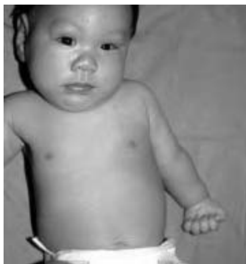
7 Paralyse complète du plexus brachial gauche et signe de Claude Bernard-Horner (myosis, ptosis et énoptalmie).