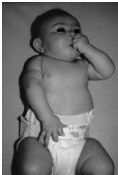
1 Paralysie C5-C6 chez un enfant macrosome pesant 6 kg à la naissance.

Enfin, des facteurs obstétricaux lors du travail sont indiscutables dans toutes les publications : une dystocie des épaules est présente dans 80 à 90 % des cas, il existe un allongement de la durée de la phase de dilatation ainsi qu'un engagement tardif de la présentation foetale [24, 33, 35, 37].