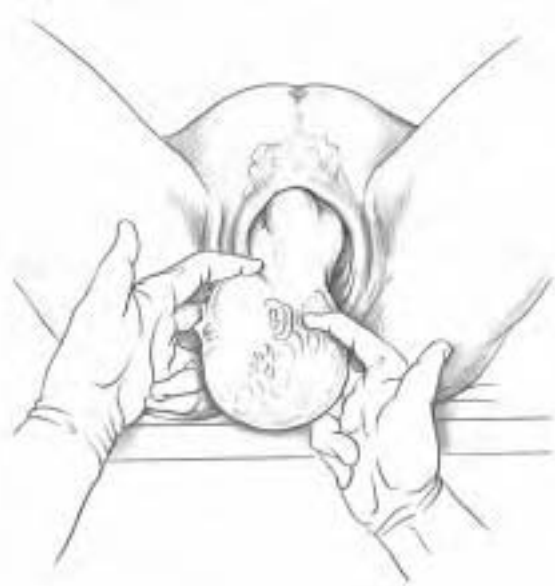
3 Naissance par voie céphalique avec traction-rotation de la tête, l'épaule étant fixe.

– l'avulsion est un arrachement des radicelles à leur issue de la moelle épinière. Très fréquemment complet, cet arrachement permet parfois de retrouver le ganglion spinal en dehors du trou de conjugaison, la partie distale de la racine présentant un aspect en « queue de radis ». Cette lésion ne permet aucun type de récupération.